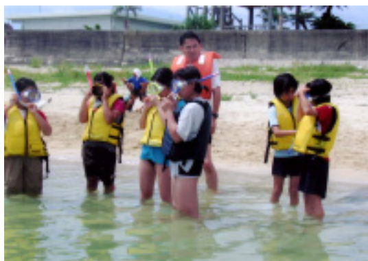
本格的なシュノーケリングにも挑戦しました