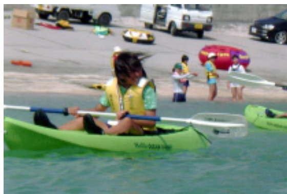
子供たちは南の海を大いに満喫