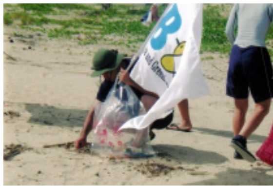
B & Gクリーンフェスティバルで浜辺の清掃にも力を入れました